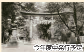
今年度中発行予定