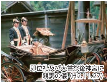
即位礼及び大嘗祭後神宮に親調の儀 (H2.11.27)