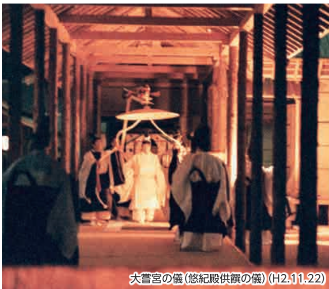
大嘗宮の儀 (悠紀殿供饌の儀) (H2.11.22)

毎年秋、天皇陛下は、その年の新穀を、御祖先である天照大御神をはじめ、神々にお供えし感謝を捧げる「新嘗祭」を宮中で御齋行になります。なかでも、陛下が御即位後初めて行われる新嘗祭が「大嘗祭」です。大嘗祭は、天皇御一代に一度行われる祭祀で、御位につかれるうえで不可欠なものであり、数ある祭祀の中で最高の重儀とされています。大嘗祭の主要な儀式としては、「齋田点定の儀」、「齋田拔穂の儀」、「大嘗宮の儀 悠紀殿供饌の儀・主基殿供饌の儀」、「大饗の儀」、「即位礼及び大嘗祭後神宮に親調の儀」などがあり、この内、「齋田点定の儀」は五月十三日に執り行われております。