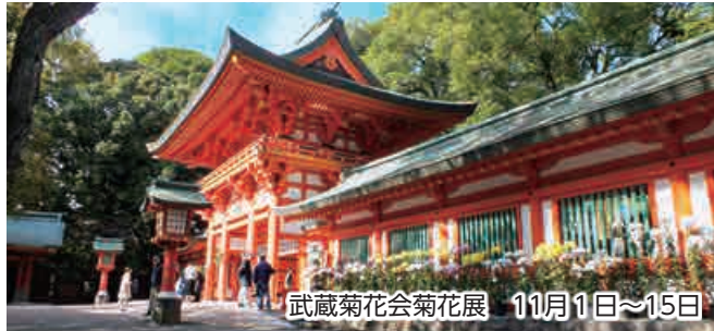
武蔵菊花会菊花展 11月1日~15日