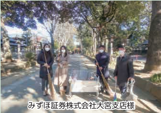
みずほ証券株式会社大宮支店様