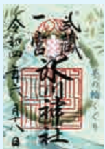
特別紙朱印 「茅の輪くぐり」 500円