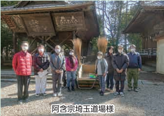
阿含宗埼玉道場様