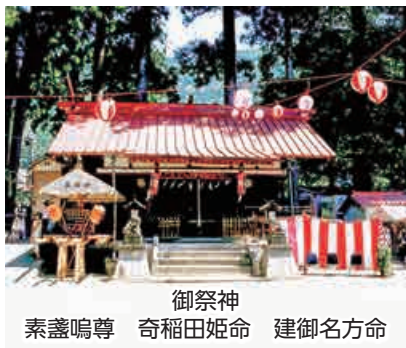
御祭神 素盞鳴尊 奇稲田姫命 建御名方命

(二三五四)祭祀を行って以来、その裔奉仕し寛文八年(一六六八)四月、代官曾根五郎左衛門が本村查繩のさい八畝一〇歩を除地した。現社殿は元禄年間(一六八八・一七〇四)の造営という。明治二年奥氷川神社と改め、同六年十二月村社に列格。 獅子舞 平成二十九年十月十五日には明治天皇御親祭百五十年を奉祝し、獅子舞を奉納頂いております。