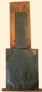
須佐之男命の版木