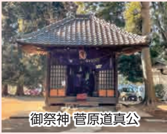
御祭神 菅原道真公

創祀は見沼に漂っていた天満天神座像を村人が社殿を建てて祀った事に由来する。十二月十日の大湯祭の特殊神饌である長芋は当地から奉納されるもの。