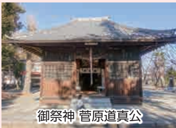
御祭神 菅原道真公

『風土記稿』に当地が「見沼代用水を引けども早損あり」とあり天水場であった事から、もとの祭祀は降雨を祈るものであったと考えられる。菅公千年記念碑の他、多くの地口灯籠が並び、拝殿には多くの拝み絵馬や額が奉納されている。