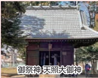
御祭神 天照大御神

当地は古く、蓮沼の中でも南部の猿ヶ谷戸と呼ばれた地域で、神社の創祀は往古村人が神宮の御師より受けた御祓大麻を祀った事に由来する。社殿は明治十三年造営。十二月十日の大湯祭の特殊神饌である長芋は当地から奉納されるもの。