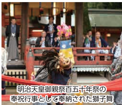
明治天皇御親祭百五十年祭の奉祝行事として奉納された獅子舞