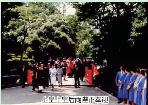
上皇上皇后両陛下奉迎