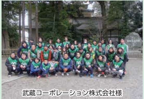
武蔵コーポレーション株式会社様