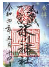
特別紙朱印「ほたる」(500円) 5月14日授与開始予定